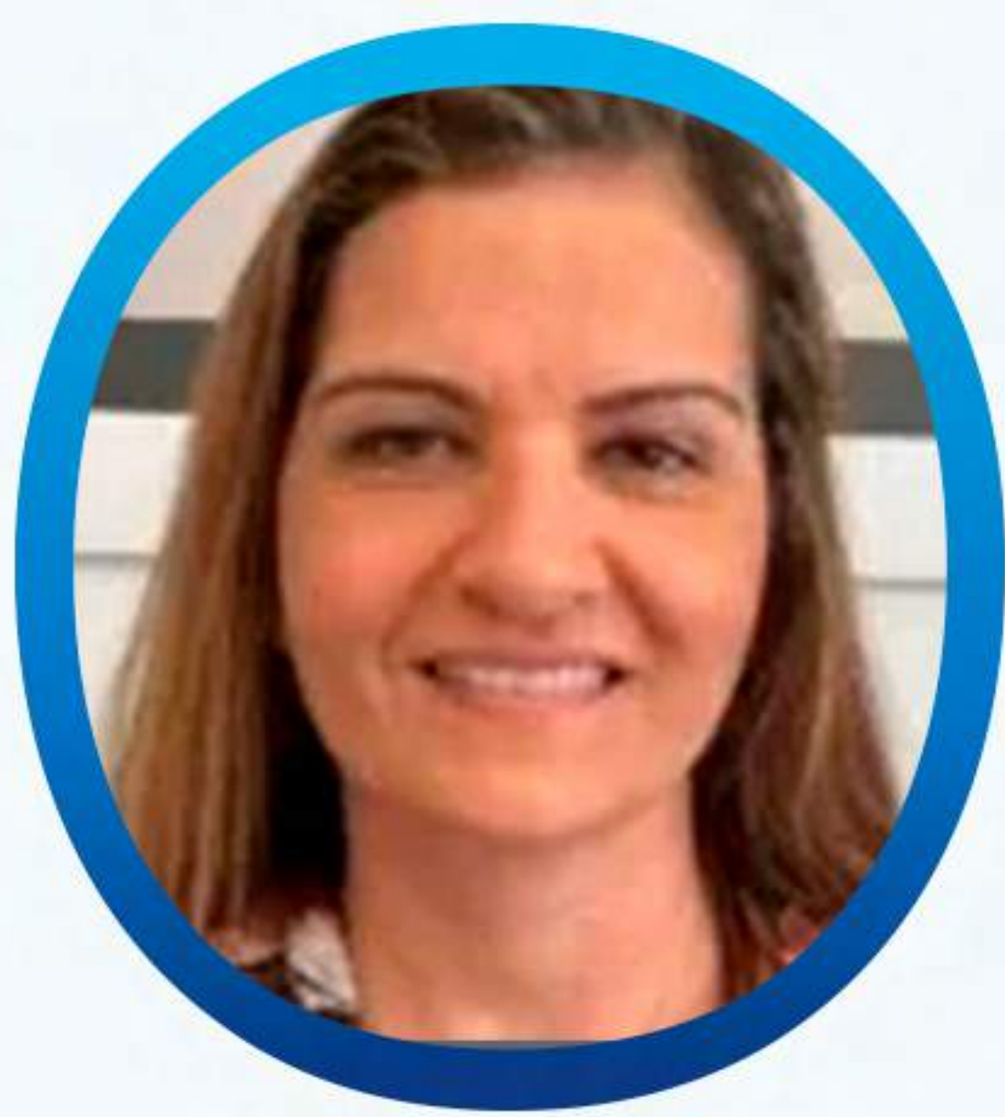
VERIDIANA CRM89155 PIVA